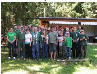
Erwachsene & Jugendliche